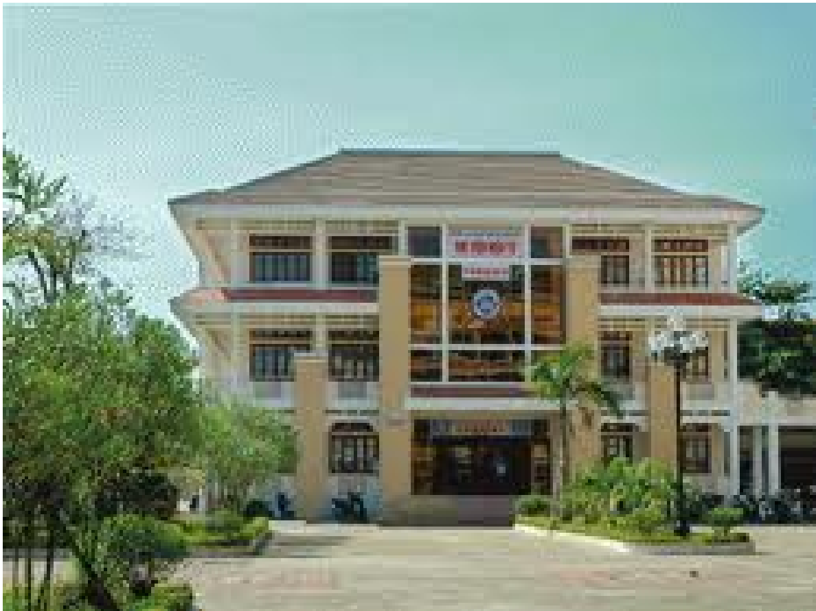
Thư viện Trường Cao đẳng Sư phạm Thừa Thiên-Huế